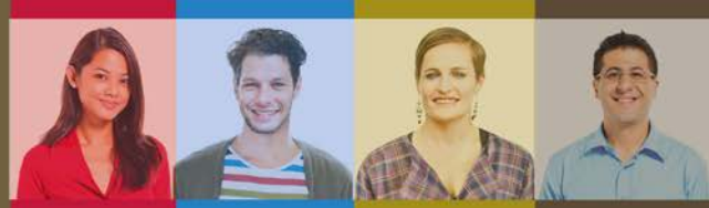
Table des matières (suite)