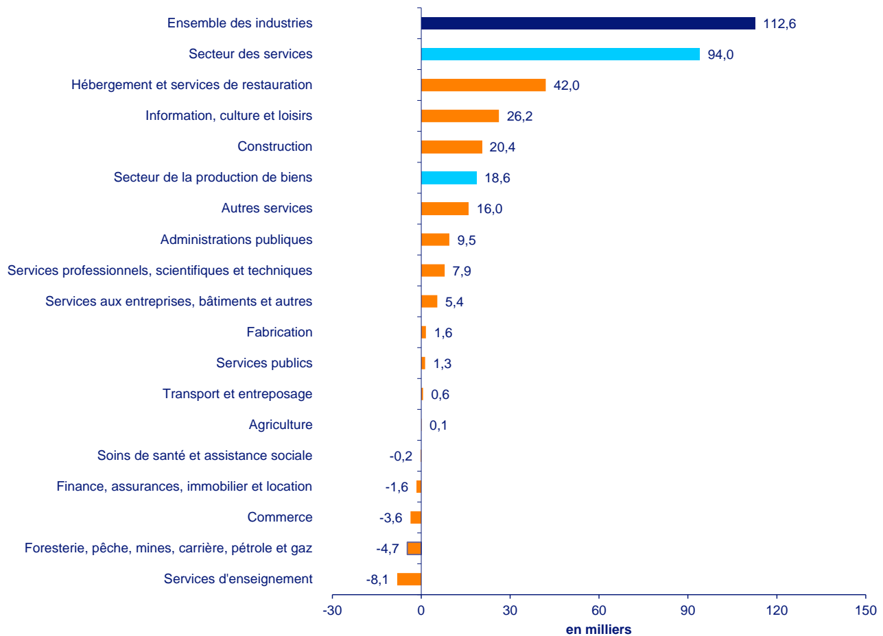
Graphique 2 : Variation de l'emploi selon l'industrie au Québec entre 2022 et 2023, moyennes de janvier à août